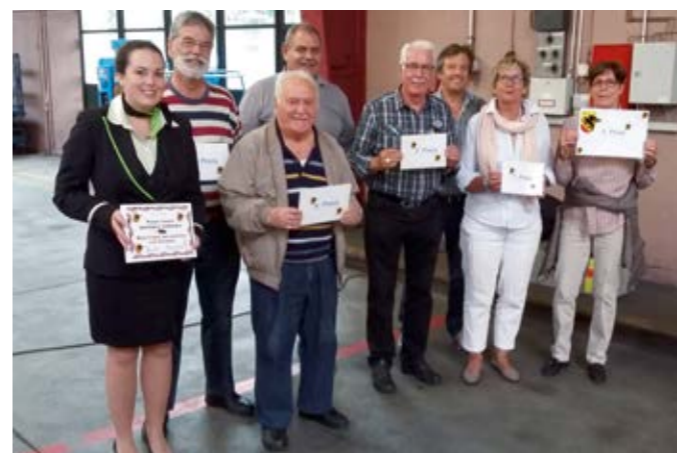
Gewinner der Verlosung anlässlich der 41. Mitgliederversammlung.

eine massvolle Entwicklung des Flughafens Bern sowie für eine sachliche Information der Bevölkerung und Behörde. Mitglieder des Vereins pro belpmoos geniessen viele attraktive und exklusive Vorteile. Eine detaillierte Auflistung mit allen Vergünstigungen und Vorteilen steht auf unserer Webseite zur Verfügung ( www.probelpmoos.ch ).