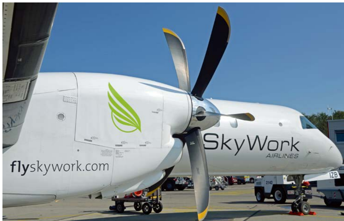
Die erste Saab 2000 von SkyWork Airlines steht seit Juli im Einsatz.