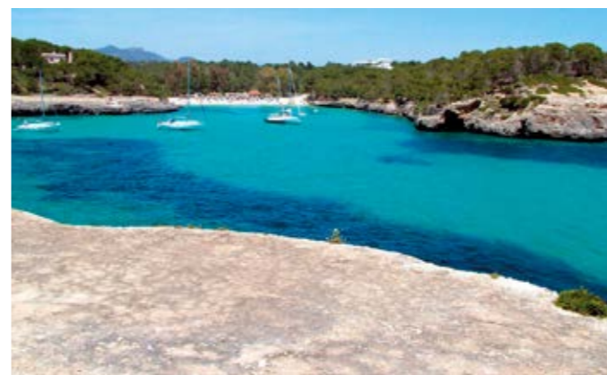
Idyllische Buchten auf Mallorca.

Links: Die Kathedrale der Heiligen Maria in Palma ist die Bischofskirche des Bistums Mallorca.