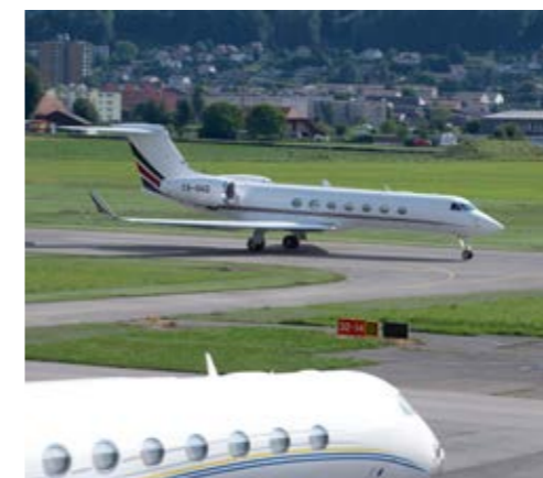
Die Piste am Flughafen Bern wird saniert. Begonnen wird mit der Erneuerung der Pistenrandbefeuung.

ten, die Umrüstung auf LED-Technologie und das Einziehen von rund 5 km neuer Kabel. Diese Arbeiten werden nachts jeweils zwischen 23.00 Uhr bis 06.00 Uhr durchgeführt. In den Nächten von Samstag auf Sonntag finden in der Regel keine Arbeiten statt. Zum Schutz vor Lärm setzt die Flughafen Bern AG die