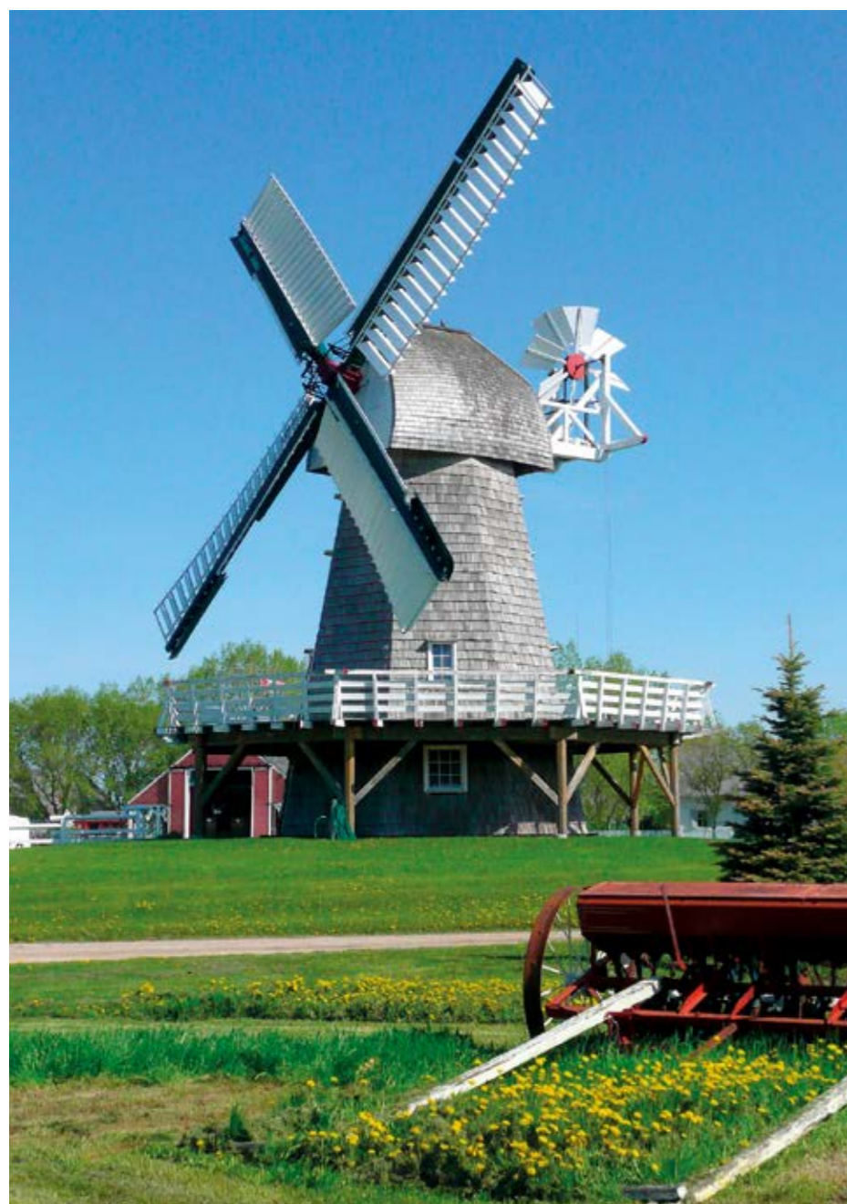
Niederlande via Amsterdam.

München und Wien. Pulsierende Strassen mit trendigen Bars, Boutiquen und schönen Weihnachtsmärkten laden zum Einkaufen und Verweilen ein und zahlreiche Sehenswürdigkeiten, Kultur- und Sportveranstaltungen bieten Ihnen unvergessliche Erlebnisse.