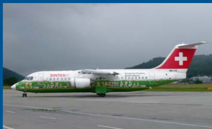
Auf einem Charterflug erfreute uns die Swiss mit der BAe 146 / RJ100 HB-IYS.