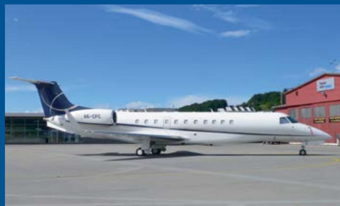
Im Register der Vereinigten Arabischen Emirate eingetragen ist die Legacy 600 A6-CPC, welche uns besucht hat.