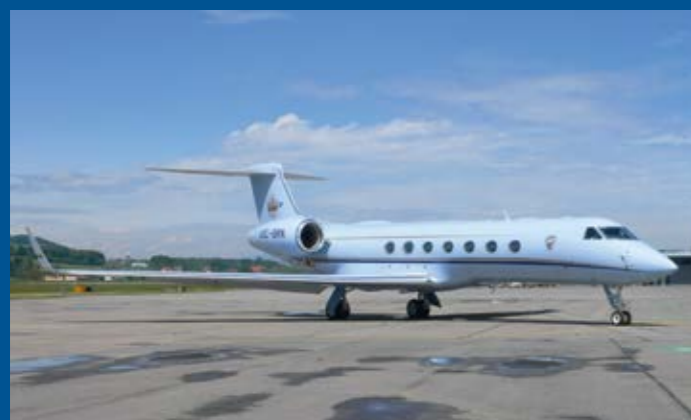
Die Regierung von Bahrain entsandte zweimal die Gulfstream G550 mit dem passenden Kennzeichen A9C-BRN nach Bern.