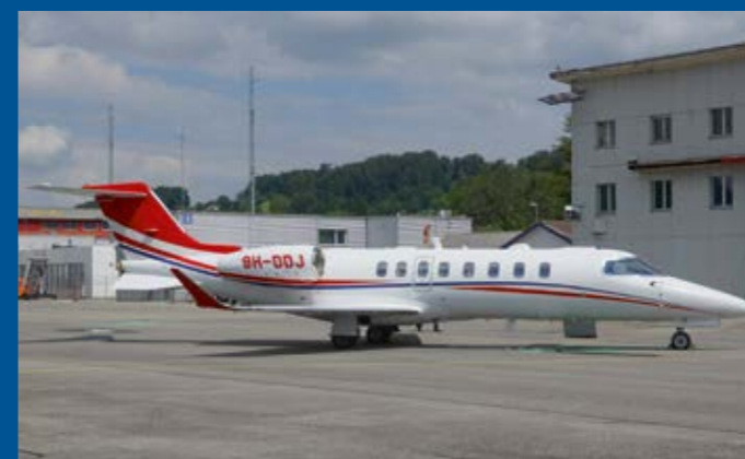
Neu im Register von Malta eingetragen wurde dieser Learjet 75 9H-DDJ.