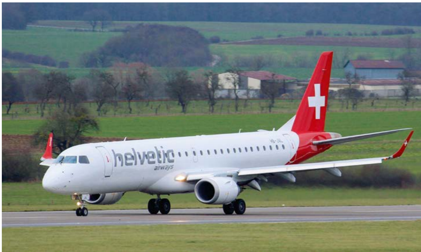
Das neueste Fluggerät von Helvetic Airways: Embraer ERJ-190LR.