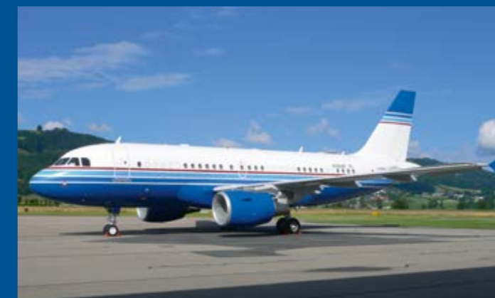
In gefälligen Farben präsentierte sich der private Airbus A319-115CJ N3618F auf unserem Flughafen.