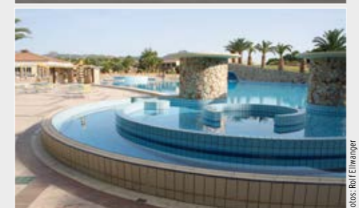
Oben: Platz für 150 Passagiere im Germania Airbus A319.