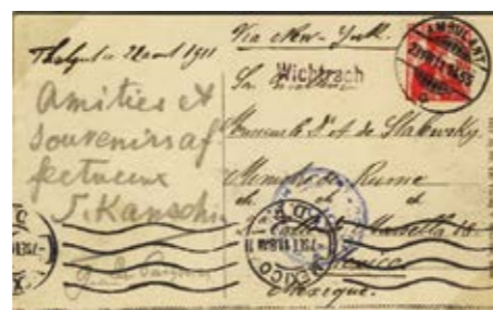
Ansichtskarte von 1911 mit Hotel Pension Thalgut an der Aare nach Mexiko-City. Rarität! Die Aufgabe der Karte erfolgte in Wichtrach (Aufgabevermerk mit Balkenstempel Wichtrach). Ambulant-Stempel mit Zug-Nummer 1455. Die Reise der Karte dauerte weniger als 3 Wochen.

Aerophilatelistische Sendungen wurden mit einem Flugzeug, einem Zeppelin, einem Ballon, einem Helikopter, d. h. mit einem Luftfahrzeug befördert. Die vom 7. bis 18. Oktober 2016 im Verkehrshaus der Schweiz in Luzern präsentierten exklusiven Ausstellungsvitrinen (etliche Dutzend) umfassen ein breites Spektrum an Themen wie «Luftpost der Schweiz im Krieg 1939-1945», «Ballon Truppe 1900-1937», «Spezielsammlung Flugvignetten der Sonderflüge 1924/1927», «Soldatenmarken der Fliegertruppen im 1. und 2. Weltkrieg», «Pro Aero Briefe», «Flugpost der Schweiz», «Die Schweiz greift nach den Sternen», «L'aérophilatelie Suisse 1907-1937», «Deutsche Katapult-Luftpost Nordatlantik» usw. Ein Besuch lohnt sich. RE