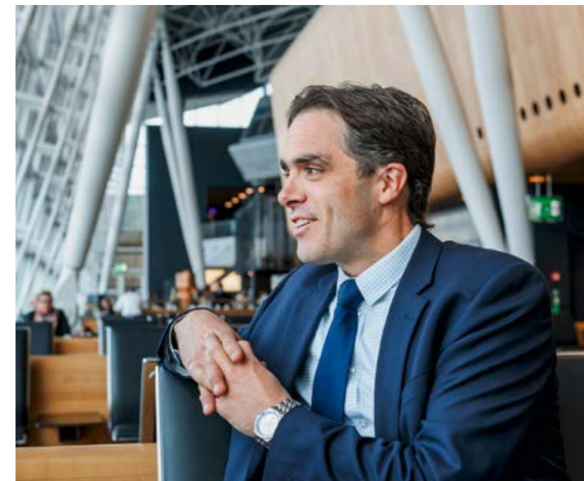
«Als Berner liegt mir der Flughafen Bern sehr nahe.»

Vor der Erteilung des AOC (Air Operations Certification) erfolgt eine umfassende technische und wirtschaftliche Prüfung. Dazu müssen die Kapitalkraft nachgewiesen und kompetente Personen innerhalb eines Unternehmens benannt werden, welche fachlich in der Lage sind, die entsprechenden Positionen auszufüllen. Ob die benannten Personen auch akzeptiert werden, obliegt der erteilenden Behörde. Diese Personen nennt man in der Fachsprache Manager (Leiter) und Nominated Person (Fachbereichsleiter).