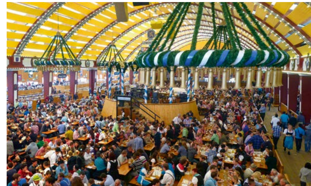
Oktoberfeststimmung in München.

Traditionsgemäss wird im Festzelt «Schottenhamel» das erste Fass Wiesnbier angezapft. Die einen sprechen von «Wiesn-Wahnsinn», die anderen von ihrer ganz persönlichen fünften Jahreszeit. Diese oder andere bekannte Begriffe reichen hier nicht aus, um dieses Spektakel zu beschreiben, welches vom 17. September bis 3. Oktober 2016 zum 183. Mal jede Menge Besu-