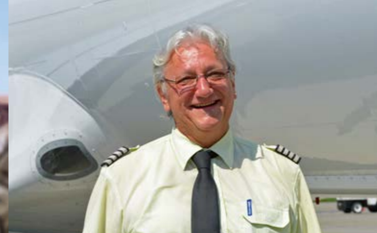
Saab 2000: Freude herrscht! (Seite 8)