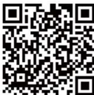
QR-Code – pour une inscription facile!

En juillet s'est déroulée la première action sur le terrain: 100 «sacs de pub» remplis de «Goodies» et un précieux matériel publicitaire d'informations sur l'Association pro belpmoos et l'aéroport de Berne ont été distribués. Les visiteurs et les voyageurs ont beaucoup apprécié ce geste et, le soir même, ont pu être enregistrés quelques inscriptions de nouveaux membres. Grâce au