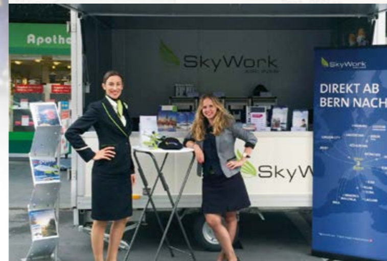
SkyWork Airlines und Flughafen Bern unterwegs in den Gemeinden (Seite 24)