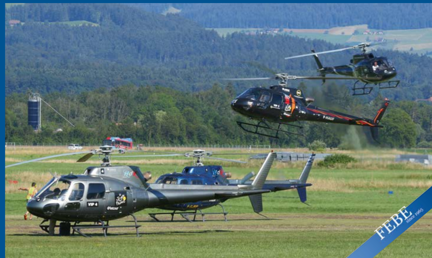
Die «Tour-de-France» machte in Bern Zwischenhalt. Begleitet wurde das Radrennen von zirka einem Dutzend französischen Ecureuil-Helikoptern in verschiedenen Versionen, welche auf dem Segelfluggelände parkiert wurden.