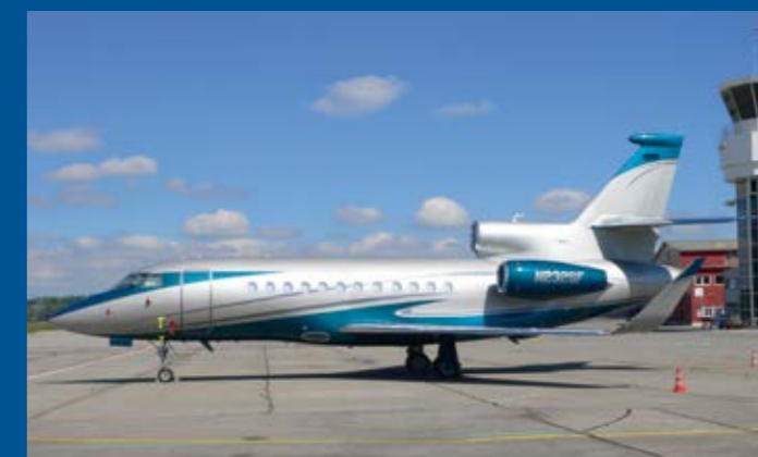
Die Falcon 900LX N232SF sorgte mit ihrem attraktiven Farbleid für Aufsehen.