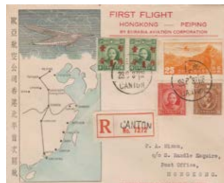
Brief vom 29. Juni 1937 von Canton nach Hongkong. Ankunftsstempel Hongkong 29. Juni 1937. Beförderung mit dem Erstflug der EURASIA über die Teilstrecke Canton-Hongkong.