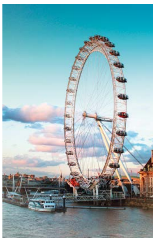
Das London Eye.