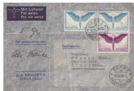
Brief vom 15. April 1939 von Bern nach Lima (Peru). Stempel Bern 1 Briefannahme 15. April 1939. Schlecht lesbare Stempel in Südamerika. Frankiert mit 2 x Flug Nr. 10 sowie 12. Der Flug über den Südatlantik am 18. April 1939 dauerte 14 Stunden und 52 Minuten.