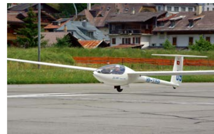
Im Segelflugzeug fühlte sich Peter Dürig wohl und zuhause.