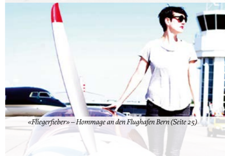
«Fliegerfieber» – Hommage an den Flughafen Bern (Seite 25)