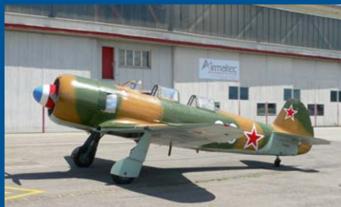
Die Firma Airmatec bot dem exklusiven Oldtimer Yak-11 F-AZJB den gewünschten Hangarplatz.