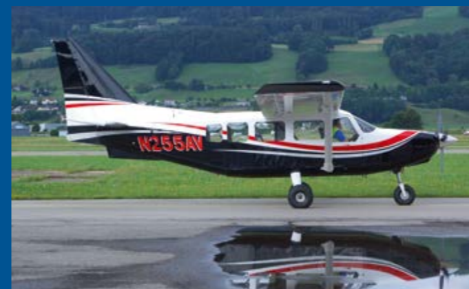
Eine Neuheit auf dem Markt ist die Gippssland GA8-TC N255AV, welche ab und zu in Bern zu sehen ist.