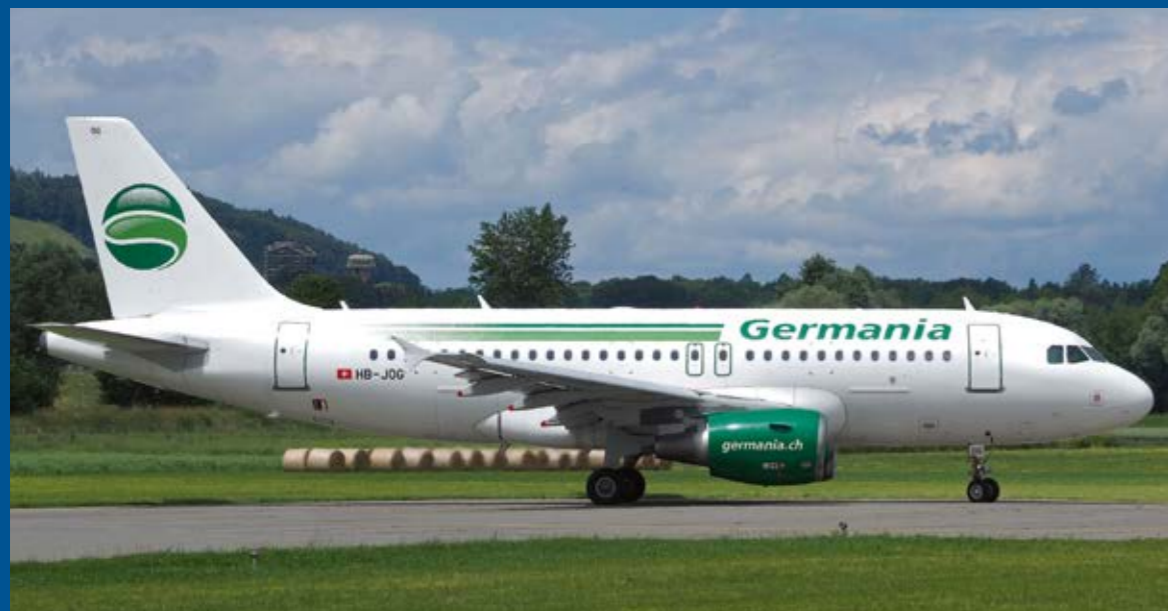
Die schweizerische Germania Flug ist jeden Sonntag mit einem Airbus A319-112 (HB-JOG/H) für den Charterflug von und nach Calvi zu sehen.