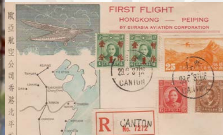
50 Jahre Schweizer Aerophilatelie (Seite 16)