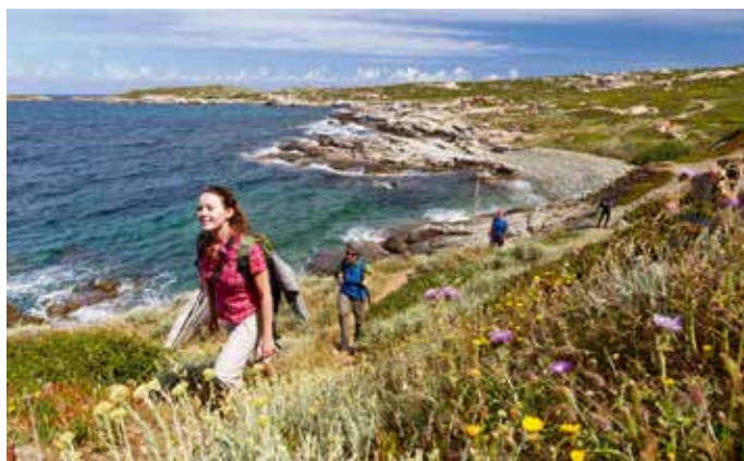
Strandliebhaber und Inselentdecker fühlen sich hier wohl.