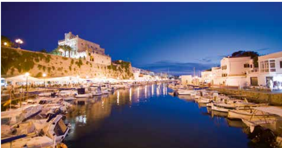
Die Baleareninsel Menorca wird ab Mai von SkyWork Airlines zweimal wöchentlich von Bern aus angefliegen.

Le salon des vacances 2017 a attiré environ 38 000 visiteurs. 300 présentations par des experts de l'industrie du voyage et de nombreux stands, y compris bien sûr ceux de l'aéroport de Berne, ont assuré des salles complètes sur les terrains BERNEXPO. Encore une fois l'aéroport de Berne était visible de loin, grâce au grand cube de lumière. Pendant quatre jours beaucoup de gens ont visité le stand pour s'informer sur les nouvelles de l'aéroport ou même pour faire des réservations. Les départs depuis Berne sont en forte demande, les brochures et les dépliants ont été distribués aux visiteurs, parmi eux une brochure avec toutes les destinations depuis Berne. Un calendrier de bureau et des autocollants avec une empreinte spéciale étaient très populaire.