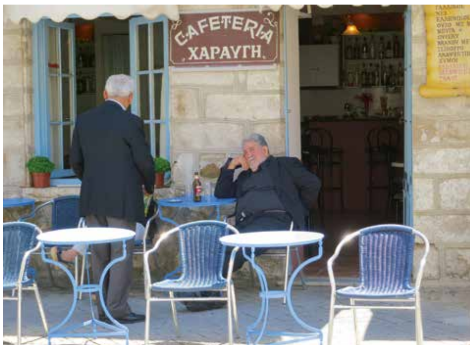
Ursprüngliche Taverne in Lefkada (oben).

Lassen Sie sich Zeit zum Entspannen und Träumen. Mit Abflug ab Bern gibt es zahlreiche weitere Reiseziele für jeden Geschmack und jedes Budget. >