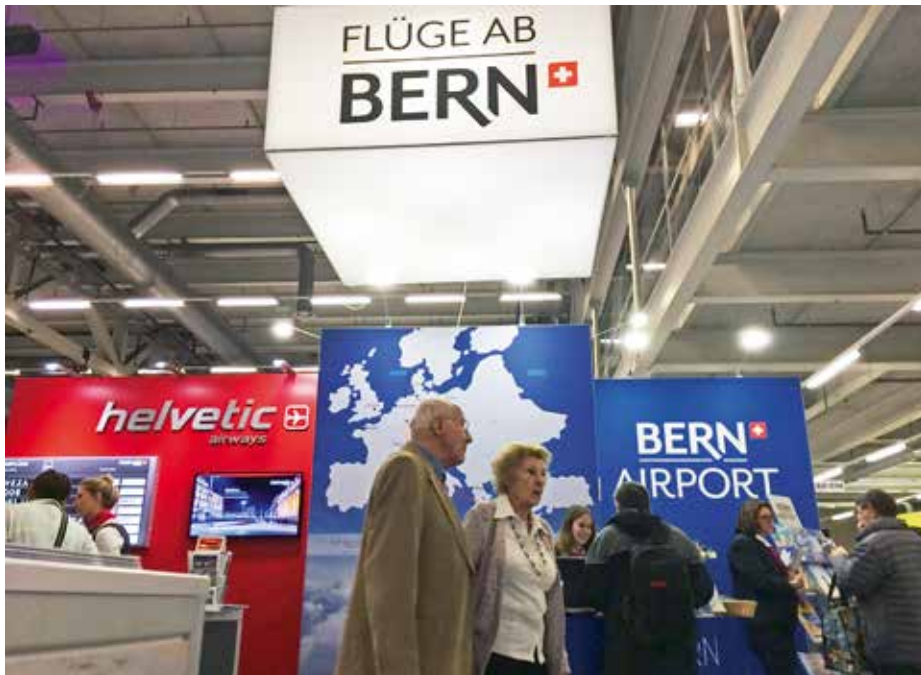
Vielbeachteter Stand des Flughafens Bern an der diesjährigen Ferienmesse.

D ie Ferienmesse 2017 hat rund 38 000 Besucherinnen und Besucher nach Bern gelockt. 300 Vorträge von Expertinnen und Experten der Reisebranche und zahlreiche Stände, darunter natürlich auch jener des Flughafens Bern, haben für volle Hallen auf dem BERNEXPO-Gelände gesorgt. Erneut war der Flughafen-Stand von weitem gut sichtbar, dank des grossen Leuchtwürfels. Während allen vier Tagen liessen sich die vielen Besucher über Neuigkeiten am Flughafen Bern beraten oder buchten vereinzelt direkt vor Ort. Abflüge und Ferien ab Bern sind sehr gefragt, Prospekte und Flyer fanden grossen Anklang. Extra für die Messe wurde eine Broschüre mit allen Destinationen ab Bern gedruckt, welche bei den Besuchern sehr gut ankam. Auch die Tischkalender und Sticker mit besonderem Aufdruck gingen weg wie «warme Weggli».