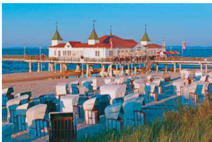
Seebücke bei Ahlbeck, Insel Usedom.