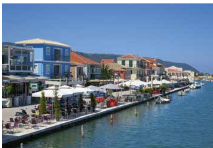
Uferpromenade Lefkada Stadt (links).