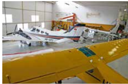
Blick in die Flugzeugwerkstatt am Berner Flughafen.