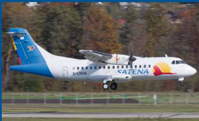
Noch in den Farben der Satena Colombia überraschte uns der ATR 42-500 mit dem neuen Kennzeichen 2-LNOA vom Guernsey-Register.