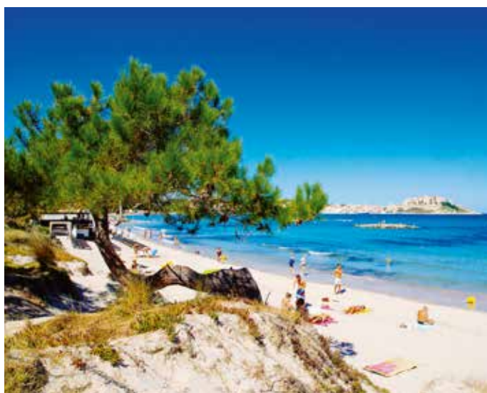
Zeit zum Ausruhen und Baden für neue Kräfte.

Welche Spuren und wie viel Wertschöpfung hinterlassen wir als Feriengäste in fremden Ländern? Was passiert mit unserem Feringeld hinter den Kulissen und wie wird mit Mitarbeitenden umgegangen? Hier hängt TourCert ein, die gemeinnützige Gesellschaft zur Zertifizierung im Tourismus. Die sogenannte Corporate Social Responsibility - unternehmerische Sozialverantwortung - ist gefragt: Welcher Anteil des Reisepreises geht ins bereiste Land? Welche Löhne werden dort bezahlt? Was passiert mit Abfall? Reiseveranstalter können sich von TourCert ihr verantwortungsvolles und nachhaltiges Handeln neutral begutachten und bestätigen lassen. Rhomberg Reisen mit seinen profilierten Inselangeboten - Korsika, Azoren, Lefkada, Madeira, Island und neu im 2017 Menorca - hat sich dem aufwändigen Prozess unterzogen und kürzlich das TourCert-Siegel erhalten.