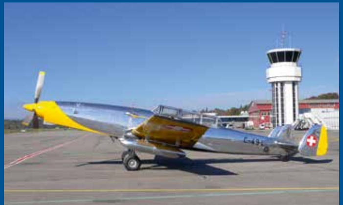
Der ehemalige Zielschlepper C-3605 HB-RDB/C-494 wird heute als Oldtimer privat betrieben.