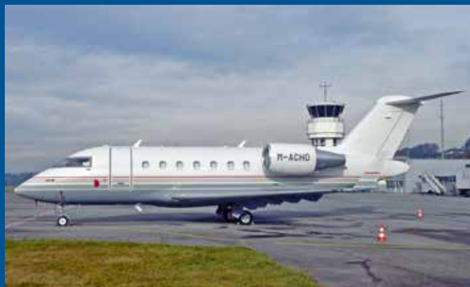
Die Challenger 605 M-ACHO kam aus Dubai nach Bern. Dieser Jet wurde anschliessend gleich umregistriert und in San Marino als T7-AOO eingetragen.