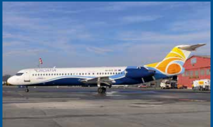
Die Fokker 100 der Trade Air/Croatia Airlines 9A-BTE zeigte sich in attraktiven Farben in Bern.