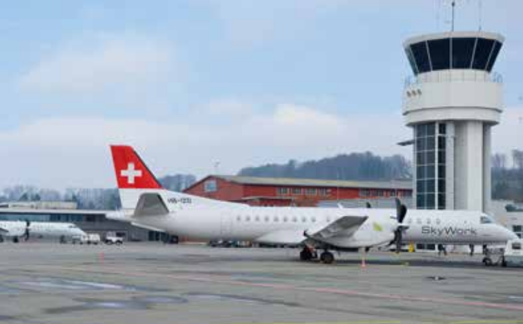
SkyWork Airlines mit neuem Angebot: Interlining mit Air France-KLM (Seite 6)