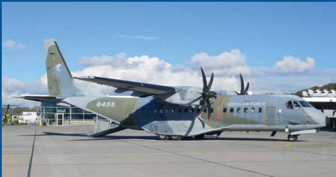
Die Luftwaffe Tschechiens besuchte uns zweimal mit der CASA C-295M «0455».

Speziell schöne, interessante oder seltene Flugzeuge und Helikopter, aufgenommen von Fotografen der Flugzeugerkennung Bern FEBE. Infos unter: www.BernAirNews.ch .