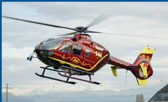
Die Lions Air/Skymedia fliegt neu mit dem EC 135P1 HB-ZS.