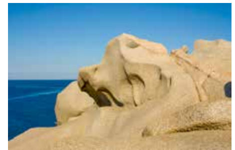
Typische Felsformation in Nordsardinien.