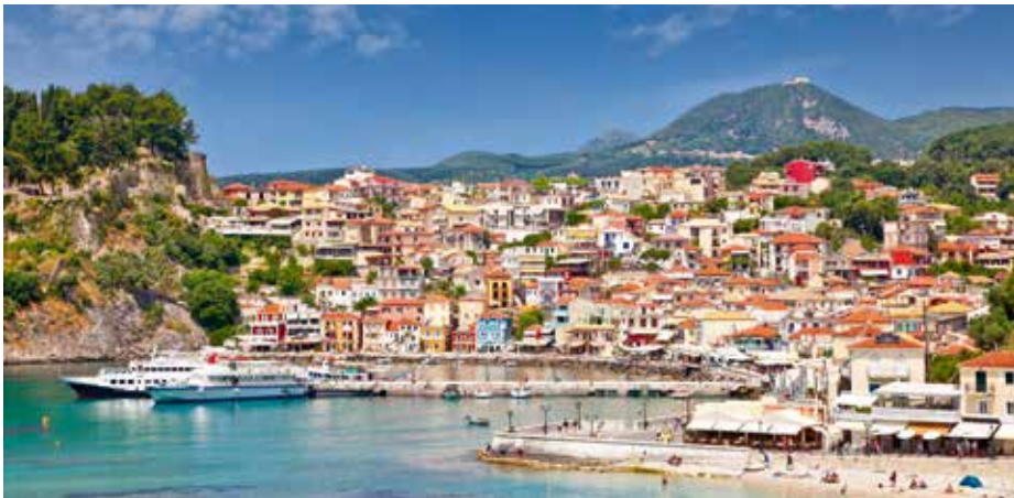
Helvetic Airways fliegt Sie ab Spätsommer nach Preveza in Griechenland. Der Badeort Parga (im Bild) liegt etwa 40 km vom Flughafen entfernt.