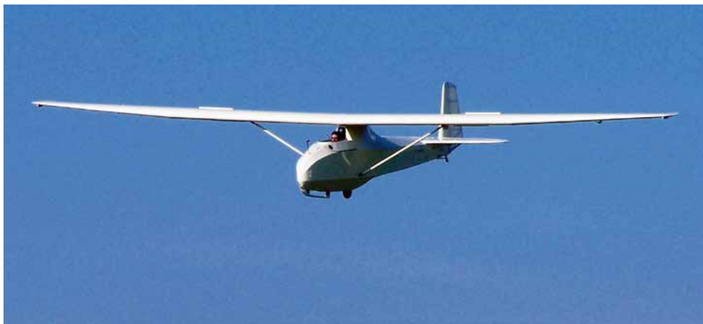
Das «Grunau Baby» – eine Holzkonstruktion aus den Nachkriegsjahren.