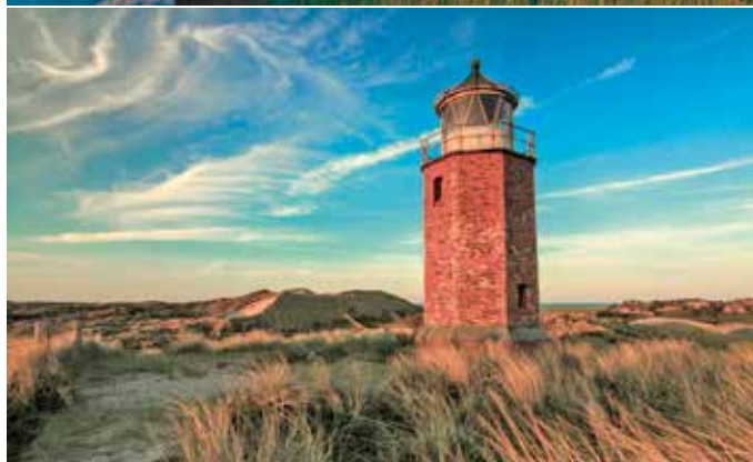
Leuchtturm auf Sylt.