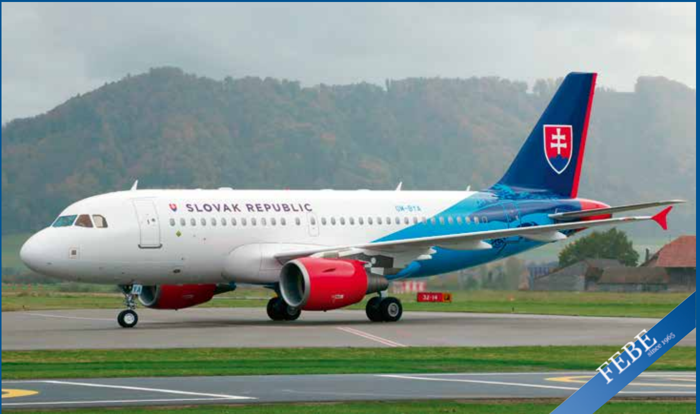
Die Regierung der Slowakei betreibt als grösstes Flugzeug den farbigen Airbus A319-115CJ OM-BYA.