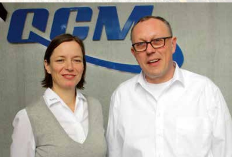
QCM im kontinuierlichen Aufwind (Seite 13)