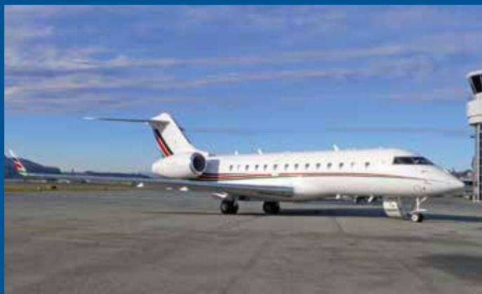
Der Global 5000 M-SAID hat ebenfalls «arabische Wurzeln» und erfreute uns gegen Jahresende zweimal in Bern.