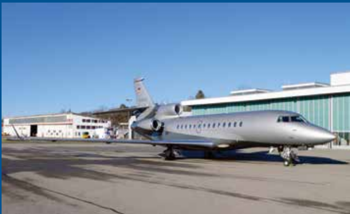
Auf der Bundesbasis zeigte sich die Falcon 7X D-APLC von ACM Air Charter.