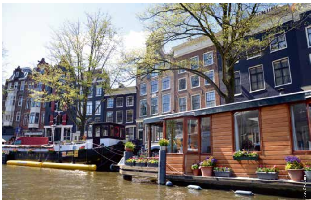
In den Grachten Amsterdams auf Flusstour. Den SkyWork Airlines-Passagieren steht dank des Codeshare-Abkommens mit der Fluggesellschaft AirFrance-KLM von Bern via den Amsterdamer Flughafen Schiphol (fast) die ganze Welt offen.

Für jeden Flug ein Ticket? Das war einmal! Das Interline-Abkommen bringt den Vorteil von nur noch einem Ticket für die ganze Flugstrecke. Auch wird das Gepäck beim Einchecken bis zur Zieldestination durchgecheckt. Ein weiterer Vorteil des Interlining ist die Registrierung des Fluggastes für seinen Anschlussflug. Im Falle einer Unregelmässigkeit des «Zubringerfluges» ist die Anschlussfluggesellschaft informiert..