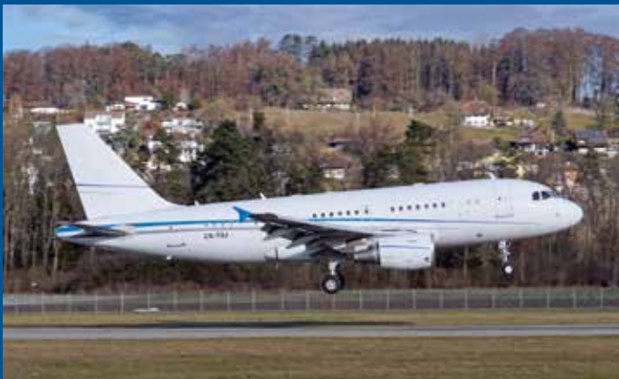
Aviation Horizons aus Saudi Arabien setzte neu für VIP-Flüge den noch portugiesischen Airbus A319-115CJ CS-TQJ ein.