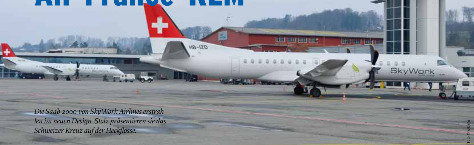
Die Saab 2000 von SkyWork Airlines erstrahlen im neuen Design. Stolz präsentieren sie das Schweizer Kreuz auf der Heckflosse.

Seit Mitte Oktober 2016 ist das Interlining-Abkommen zwischen SkyWork Airlines und Air France-KLM gültig.