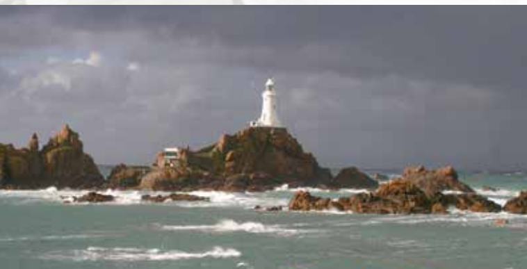
Verein pro belpmoos-Reisebericht: Jersey – eine Insel geschaffen aus Wellen (Seite 33)