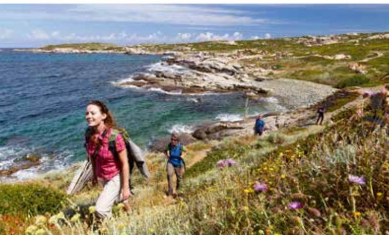
Rhomberg Reisen: Ab Mai neu direkt von Bern nach Mahon (Seite 11)