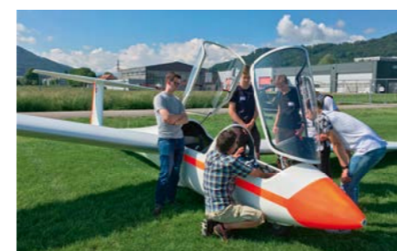
Segelflug im Doppelsitzer