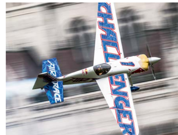
Don Vito Wyprächtiger fliegt bei den Red Bull Air Races (Seite 22)