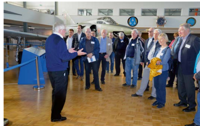
Begeisterte Mitglieder und Gäste während der Führung im Museum.