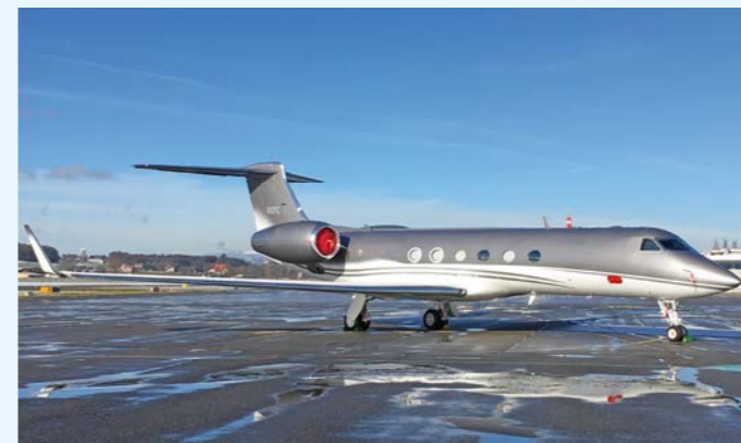
Ein weiterer Erstbesucher am Berner Flughafen war die Gulfstream G5 N6PC.