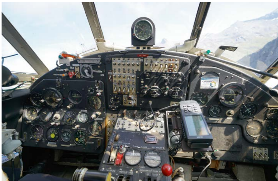
Cockpit der Antonov AN-2.

ke Reiseflugzeuge und Hubschrauber sowie exklusive Business-Jets werden dieses Jahr auf dem Messegelände in Friedrichshafen zu sehen sein. Aber auch autonom fliegende, senkrechtstartende Fluggeräte (VTOL) sollen vorgeführt werden.