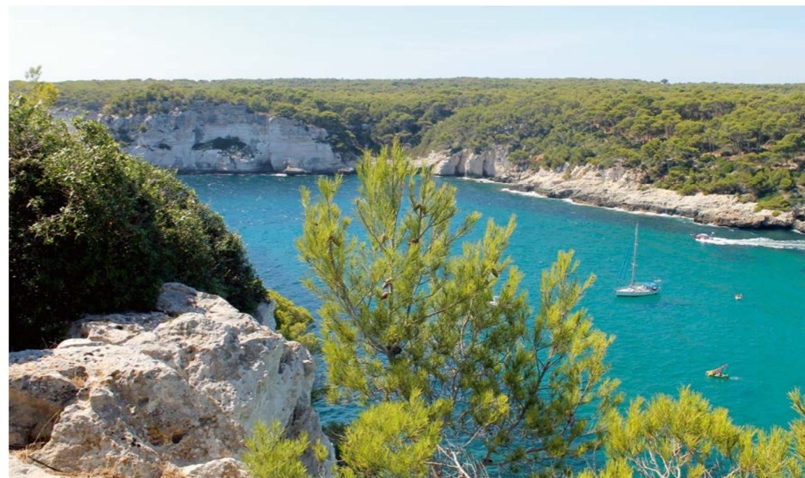
Menorca mit seinen malerischen Buchten.

Belpmoos Reisen AG Erlenauweg 17 3110 Münsingen 031 720 33 00 info@belpmoos-reisen.ch www.belpmoos-reisen.ch