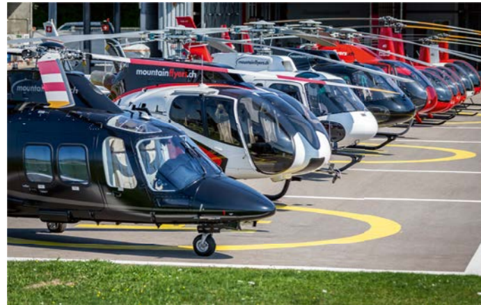
Vom Schulungshe- likopter (rechts) bis zum zweimotorigen AW109 für Taxiflüge (links) – Mountain Flyers 80 Ltd. verfügt über eine breite Pa- lette und bietet be- sondere Erlebnisflüge an.

Von der Basis auf dem Flughafen Bern sowie der Basis am Flughafen Grenchen wird zu unvergesslichen Helikopterflügen gestartet. Privat- und Geschäftsleute sowie Firmen nutzen das vielfältige Angebot. Selber Fliegen will gelernt sein – auch das ist möglich.