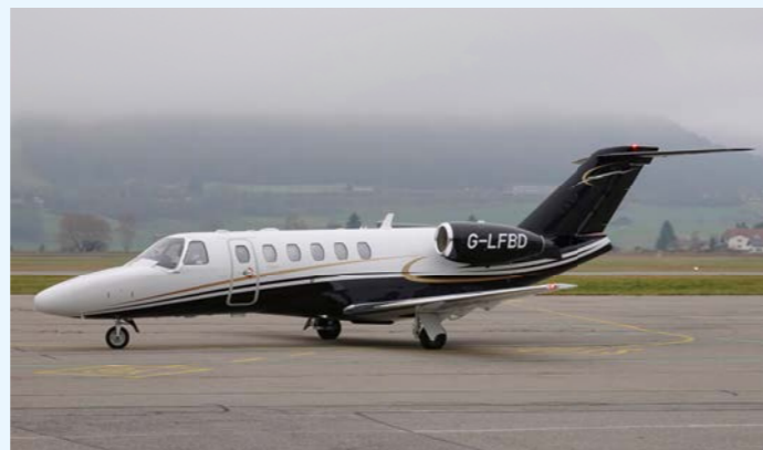
Trotz trübem Wetter ist die attraktiv bemalte Cessna Citation CJ2+ G-LFBD ein Blickfang.