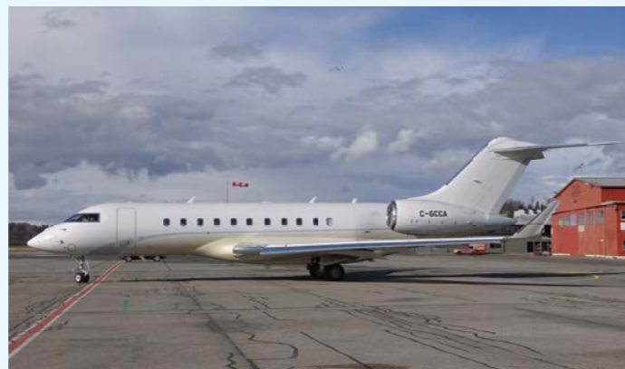
Zu den zahlreichen Erstbesuchern in diesem Winter am Berner Flughafen zählt auch die Global 5000 C-GCCA.