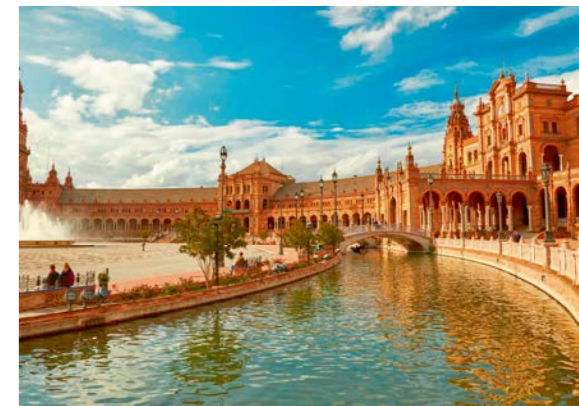
Die Feriendestinationen 2019 ab Bern (Seite 6)