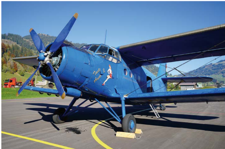
Mit der «Tante Anna» an die Aero 2019 nach Friedrichshafen – pro belpmoos macht's möglich!

Die legendäre Antonov AN-2 ist inzwischen schon fast zum Geschäftsflugzeug des Vereins geworden: Letztes Jahr stand der grösste einmotorige Doppeldecker bereits für zwei Vereinsflüge nach Saanen zum neu eröffneten Gstaad Airport im Einsatz. Dieses Jahr fliegt uns Berufspilot Christoph Dubler direkt an die Aero 2019 nach Friedrichshafen. Ultimate- und Segelflugzeuge, leistungsstarke