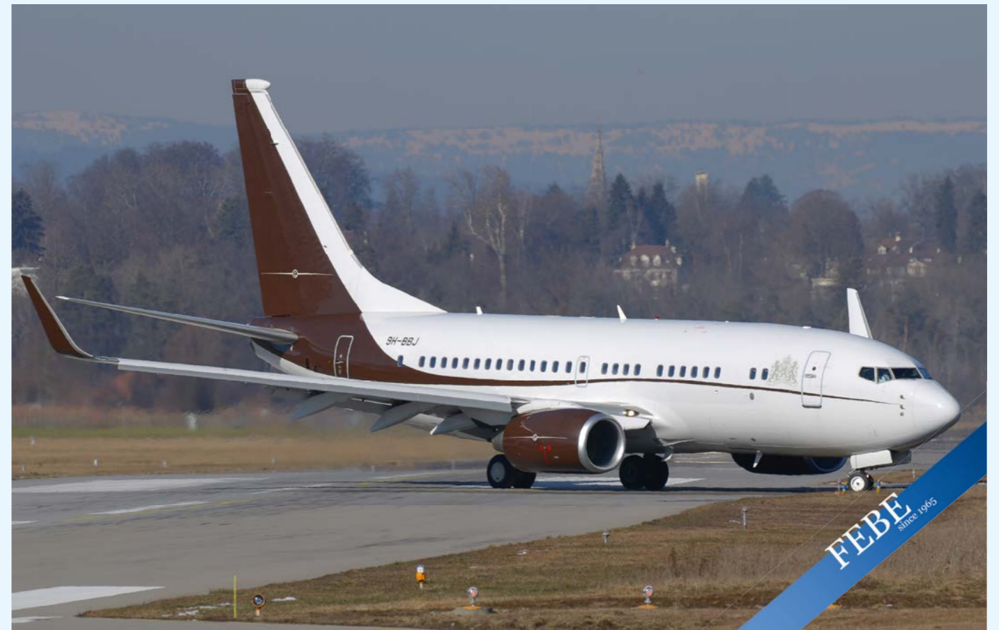
Die Boeing 737-700 9H-BBJ brachte den Niederländischen Premierminister Mark Rutte zu einem Besuch nach Bern.