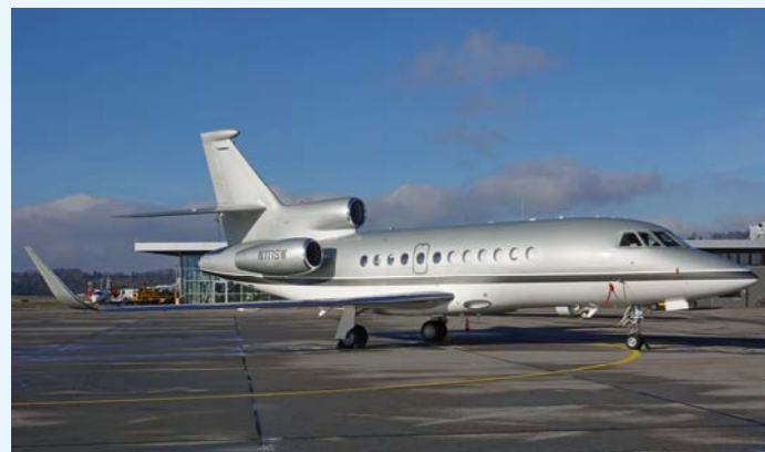
Direkt aus Teterboro traf kurz vor Weihnachten die Falcon 900 N111SW im Belpmoos ein.