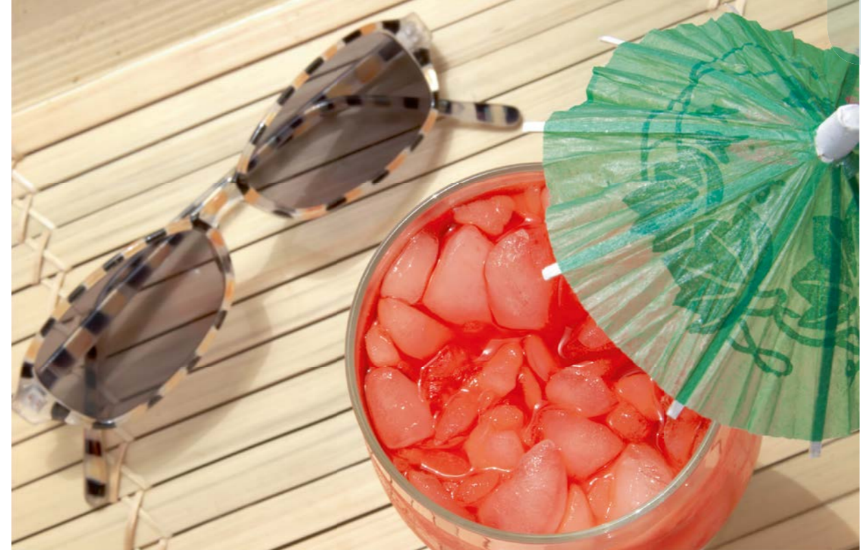
Ferienflüge ab Bern: Viel Sonne und «Dolce far niente» garantiert!

Direktflüge ab Bern mit Helvetic Airways, jeweils samstags. Eines der faszinierendsten Reiseziele Europas! Ein grosses Angebot an Strand-, Aktiv- und Familienferien, an Bus- oder Mietwagenreisen verspricht traumhafte, eindruckliche Erlebnisse im Süden Europas. Andalusien liegt an der Südspitze Spaniens, wo bis zum Ende des 15. Jahrhunderts die 800 Jahre dauernde Besetzung durch die Mauren eindruckliche kulturelle Spuren hinterlassen hat. Nur gerade 14 Kilometer südlich von Gibraltar beginnt der afrikanische Kontinent. Das Klima an der Costa de la Luz wird ihrem Namen gerecht und verbindet das Ideale zweier Welten: Die Sonnengarantie des spanischen Südens mit der angenehmen Frische des Atlantischen Ozeans. Die kilometerlangen, feinsandigen, von Dünen gesäumten Strände bieten reichlich Raum für ungestörte Badeferien.