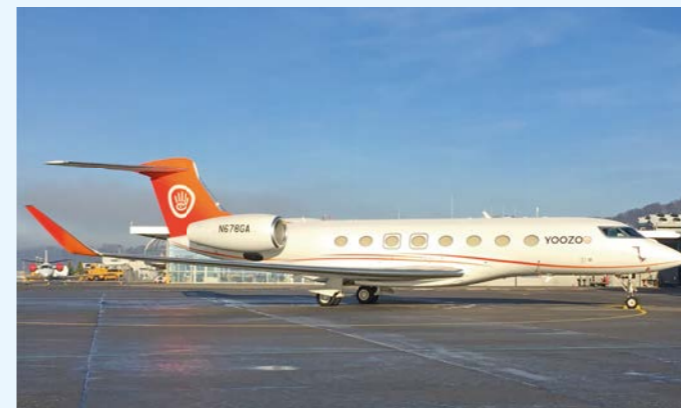
Die Gulfstream G650 N678GA präsentiert sich dem Fotografen im schönsten Sonnenlicht.