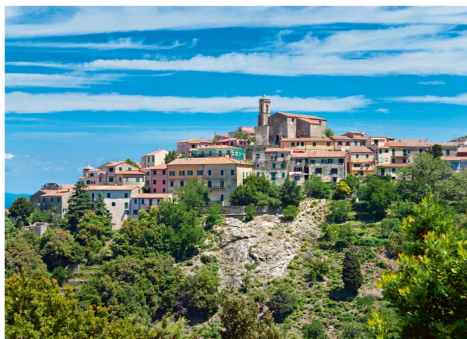
Die Insel Elba ist im Sommer und im Herbst eine Reise wert!

Belpmoos Reisen AG Erlenauweg 17 · 3110 Münsingen 031 720 33 00 · belpmoos-reisen.ch