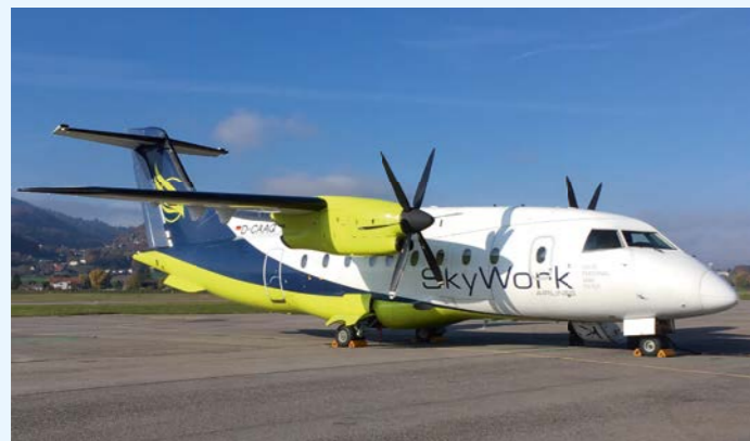
Endgültig Geschichte: Anfangs November 2018 verliess uns diese Dornier 328 als letzter Zeitzeuge von Skywork Airlines.