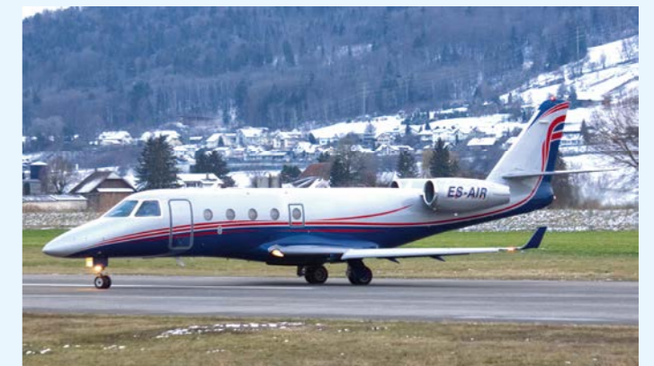
An einem Januarabend konnte die Gulfstream G150 ES-AIR beim Start nach Moskau auf Piste 14 beobachtet werden.