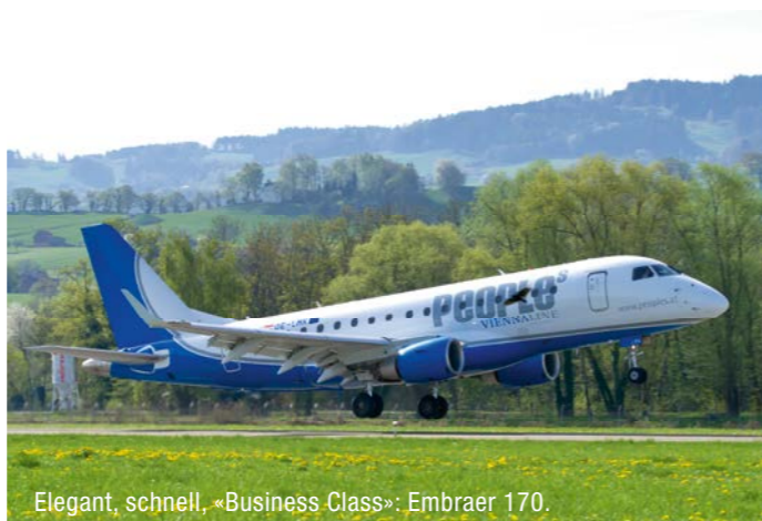
Elegant, schnell, «Business Class»: Embraer 170.

Fliegen ist nicht einfach nur Fliegen. Wer mit People's nach Menorca fliegt, lernt den entscheidenden Unterschied kennen: Fliegen als Erlebnis!