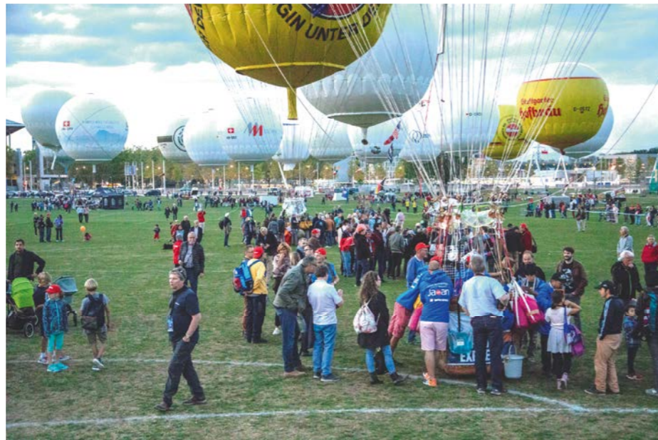
Stimmung vom Gordon Bennett-Anlass auf der Berner Allmend (oben), an welchem der Berner Aero-Club einen eigenen Stand hatte (unten).