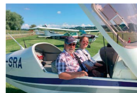
Motorflug am Doppelsteuer

Melde dich an – am besten heute noch – unter www.ikarustag.ch . Die Teilnehmerzahl ist beschränkt. Die Anmeldungen werden in der Reihenfolge des Eingangs berücksichtigt.