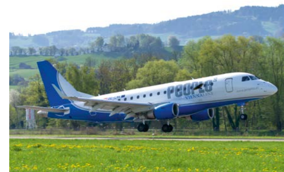
People's und Zimex Aviation fliegen Sie ab Bern in die Ferien (Seite 12)