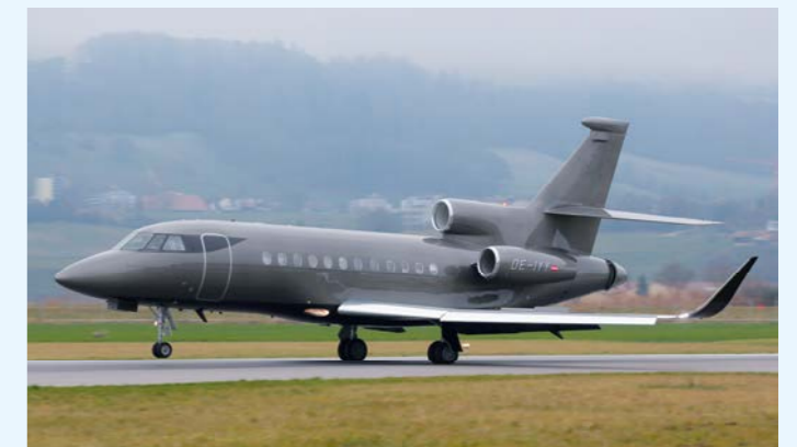
Obwohl erst im November 2018 abgeliefert, gehört die Falcon 900 OE-IYY bereits zu den regelmässigen Besuchern in Bern.